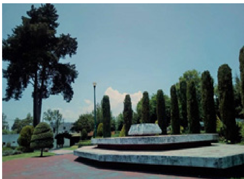
Basamento del monumento a Sor Juana Inés de la Cruz, de donde se sustrajo la Estatua de metal de esta mujer ilustre del virreinato, en la ciudad de Toluca.