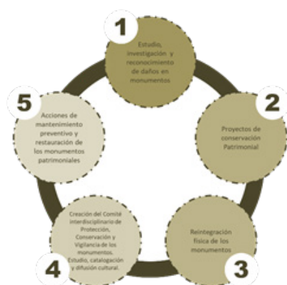
Diagrama 2. Estrategias para la conservación de monumentos histórico - patrimoniales (Mejía M., Espinosa M. 2019).

En la ciudad se deben generar sistemas de seguridad que permitan la vigilancia de los bienes muebles para prevenir nuevamente su sustracción. Pero sobre todo se requiere de una serie de estrategias para la conservación de monumentos históricos patrimoniales (Diagrama 2), que incluyen las tres etapas de la metodología mencionada. Ante todo, se resalta la creación de un comité interdisciplinario de protección, conservación y vigilancia de monumentos del ayuntamiento de Toluca, que se encargue además del estudio, de la catalogación y difusión cultural de los mismos. Que realice y supervise las acciones de mantenimiento preventivo y restauración de monumentos patrimoniales.