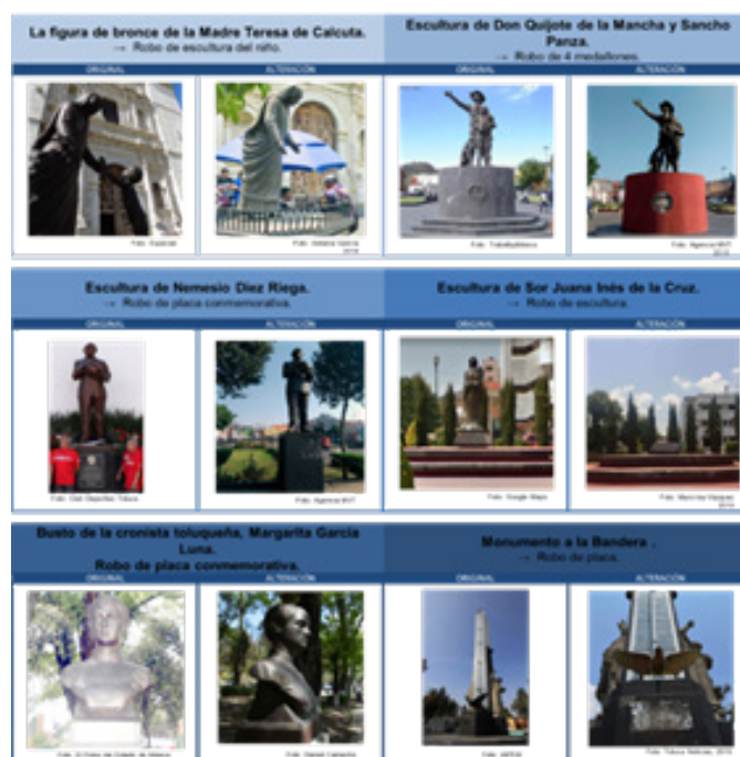
Imagen 3. Bienes muebles patrimoniales hurtados o desaparecidos parcial o totalmente en Toluca (Varios, 2019).

En la siguiente ilustración (imagen 3) se encuentran seis de los bienes muebles hurtados parcial o totalmente, se observa el nombre del monumento, su estado original y las alteraciones físicas que tuvo el objeto patrimonial. Es decir, su pasado y su presente en el devenir cultural de la entidad.