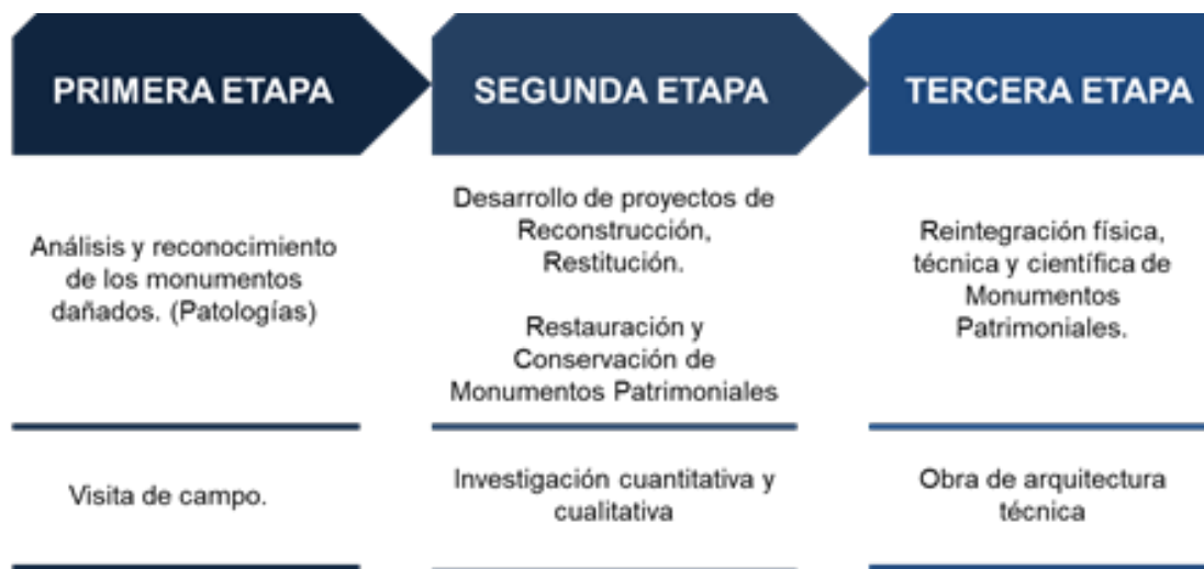
Diagrama 1. Proceso de desarrollo de reintegración de monumentos histórico-patrimoniales (Mejía M., Espinosa M. 2019).

Debido al alto índice de robos participación de delincuentes y la apatía de los ciudadanos para cuidar, proteger y denunciar estos abusos realizados al patrimonio cultural. Los investigadores preocupados por esta problemática proponemos, de manera inmediata, trazar tres etapas para la reparación de daños cuyas acciones corresponden a visitas de campo, investigación y obra de arquitectura técnica. Como se observa en el siguiente cuadro sinóptico (Diagrama 1). Cada una de estas etapas tiene una meta: en primer lugar, el análisis y reconocimiento; posteriormente el desarrollo de proyectos; y finalmente la reintegración de los monumentos patrimoniales.