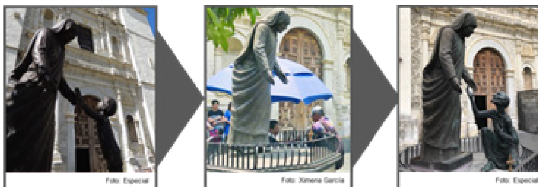
Imagen 1. Escultura de la Madre Teresa de Calcuta (Varios 2018).

Monumento a Don Quijote de la Mancha. Otro caso fue el ultraje de la escultura al Quijote de la Mancha y Sancho Panza situada al este de la iglesia del Carmen, en la Plaza España, ésta fue despojada de los cuatro medallones que se encontraban fijados en un pedestal con forma cilíndrica, estos fueron creados por el escultor y grabador Lorenzo Rafael, quien propuso en alto-relieve algunos de los pasajes más célebres de la obra de Cervantes. Ambos casos fueron reportados en el mes de abril del 2018.